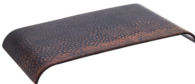
PLANCHE GN 1/3